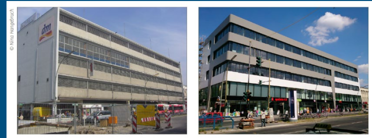
Berlin Turmstraße, ehem. Hertie-Kaufhaus, heute Mischnutzung mit Handel, Fitness und studentischem Wohnen

Quelle: Laufendes ExWoSt-Projekt „Kauf- und Warenhäuser im Wandel. Kleiner baukultureller Statusbericht“, BBSR RS 7