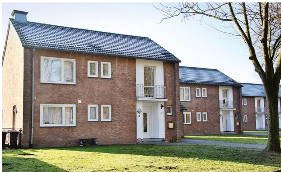
Britensiedlung im Stadtteil Coerde in Münster | Stadt Münster Housing estate built for officers of the British troops in Coerde district of Münster.

Engaging with building stock of high conservation value drives forward the public and expert conversation on building culture while also contributing quantitatively and qualitatively to promoting the value of architectural heritage in its full breadth – which thus also contributes to its protection. In Austria, bringing the urban community on board was key to imple-