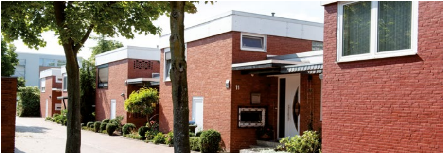
Prototyp-Einfamilienhausvarianten im Trabantenstadtteil Detmerode der Stadt Wolfsburg | complan Kommunalberatung · Varying prototypes of single family houses in the satellite district of Detmerode, Wolfsburg.

den Fokus. Themen, die mit dem Erhalt und der Weiterentwicklung des historischen Bestandes verbunden werden können. Umso wichtiger ist es jetzt, die historischen Räume in unseren Städten zu pflegen. Dies kann nur gelingen, wenn der historische Bestand in seiner Gesamtheit, bestehend aus Denkmälern und Denkmalensembles, aus besonders erhaltenswerter Bausubstanz aus sämtlichen Epochen und Zeitschichten, aus Gebäuden, Straßen und Plätzen, Frei- und Grünflächen, in den Blick genommen wird. Nur dann können die historischen städtebaulichen Strukturen und Elemente in Stadt- und Ortslagen, in historischen Altstadtkernen, Quartieren und Siedlungen fortbestehen.