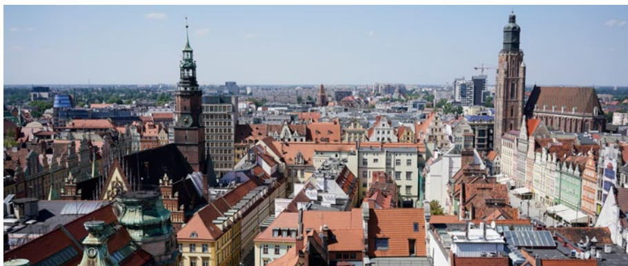
Dachlandschaft von Wrocław | Thomas Arns · Roofs of Wrocław

Poland has a great deal of experience in the maintenance of built heritage, with Polish restoration skills enjoying a strong international reputation. Social acceptance of the historic building stock is very strong; it is seen as both attractive and identity-creating, regardless of how much of the stock is still comprised of original elements. Often, inclusion on the heritage list is seen as the only option to preserve building stock that is valuable or seen as such; the heritage authorities thus have a great deal of sway.