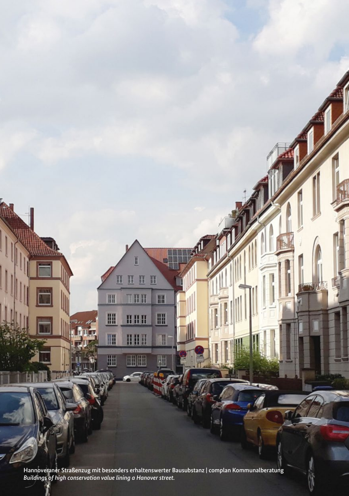
Hannoveraner Straßenzug mit besonders erhaltenswerter Bausubstanz | complan Kommunalberatung Buildings of high conservation value lining a Hanover street.