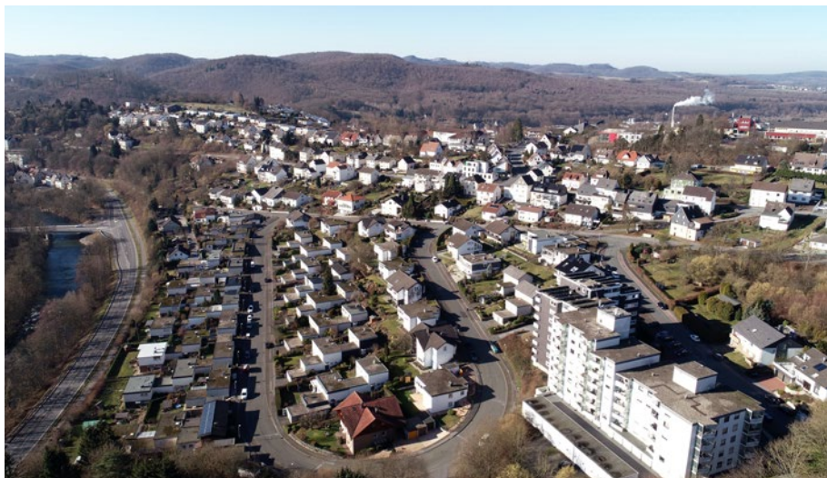
Siedlung „Klein-Jerusalem“ in Arnsberg “Little Jerusalem” is what inhabitants of Arnsberg call this estate of bungalows.

It is only when the interested public supports the urban planning sector that high-quality development of our European towns, cities and communities can take place – thus ensuring acceptance and identity-creation. The model municipality of Arnsberg took a unique path in surveying its high conservation-value building stock. The town of Arnsberg in North Rhine-Westphalia has a population of 74,000 and is on the List of German Towns and Cities with Historic Town Cores. Informational and participation programmes referred to by the town as “soft instruments” have increased appreciation for the historic