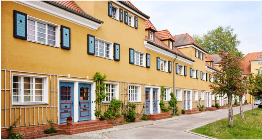
Fassadenansicht der Reihenhäuser in der Werksiedlung Piesteritz in Lutherstadt Wittenberg | complan Kommunalberatung · Rowhouses in the workers' housing estate of Piesteritz, Lutherstadt Wittenberg

bestandsorientierte Stadtentwicklung. Sie macht den historischen Bestand sämtlicher Epochen, bis hin zu jungen Bauten aus dem letzten Jahrzehnt des vergangenen Jahrhunderts, zum Ausgangspunkt ihrer Planungen. Dabei wird der gesamte Bestand – Denkmale und besonders erhaltenswerte Bausubstanz – betrachtet. Dieser Vorgehensweise fühlen sich viele europäische Länder und Kommunen verpflichtet. Sie setzen sich auf unterschiedliche Weise für die besonders erhaltenswerte Bausubstanz ein. In Deutschland findet die Beschäftigung mit der besonders erhaltenswerten Bausubstanz im Rahmen der unterschiedlichen Verantwortungsbereiche und Zuständigkeiten auf Bundes-, Landes- und kommunaler