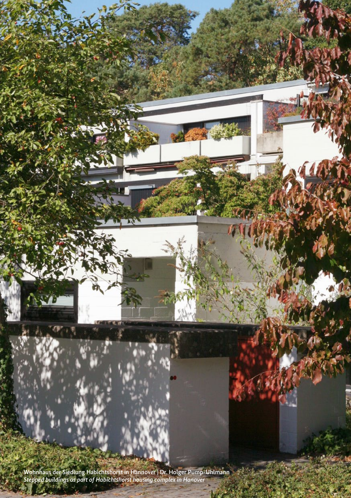
Wohnhaus der Siedlung Habichtshorst in Hannover | Dr. Holger Pump-Uhlmann Stepped buildings as part of Habichtshorst housing complex in Hanover