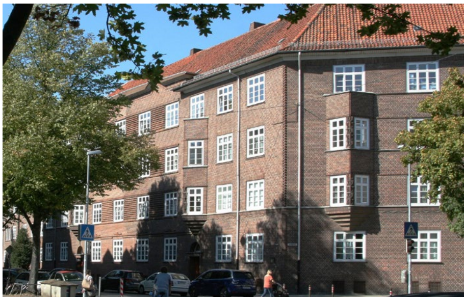
Expressionistische Gestaltungsmotive und einheitliches Fassadenmaterial in der Hannoveraner Südstadt | Dr. Holger Pump-Uhlmann Expressionist shaping and clinker facades are very common in Hannover's Südstadt district.

Hannover is one of the cities that were very heavily destroyed in the Second World War and later transformed in the post-war era. The city thus lost a great deal of its historic building stock. When surveying high conservation-value building stock, the city administration set the set itself the