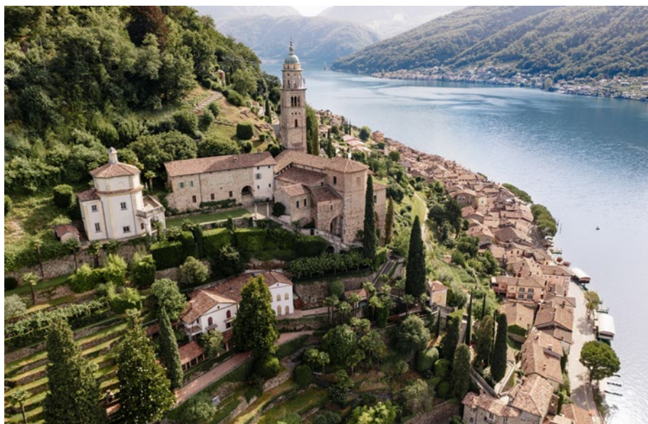
Morcote im Kanton Tessin, Dorf von nationaler Bedeutung | Schweiz Tourismus/Doyenne+ david&kathrin The village of Morcote in the canton of Ticino is listed as a built site of national importance.

Switzerland is the only country in the world to have a comprehensive inventory of visual urban landscapes. For over 40 years, the senior administrative unit in Switzerland has been compiling the Federal Invento-