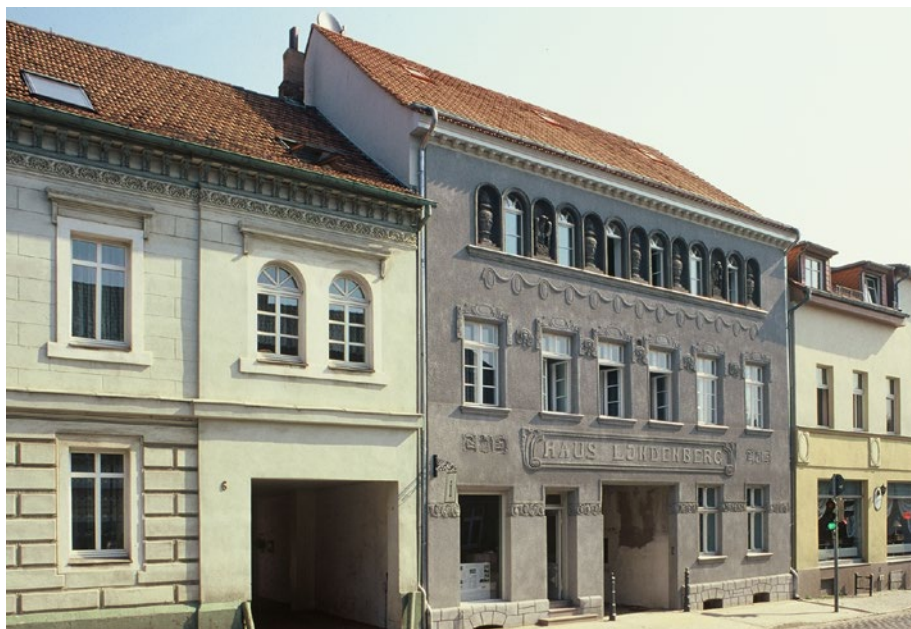
Historische Fassaden im Stadtkern von Altlandsberg | AG Städte mit historischen Stadtkernen Historic facades in Altlandsberg town core

The European town and city is a byword for compact urban structures, building stock from many eras, and a mixed, diverse use in all areas of life. With their urban morphology of historic town cores, settlements, districts, parks, and open spaces, European towns and cities connect Europe together. In many European towns and cities, stylistic elements from other countries in Europe are visible – an architectural sign of European towns, cities and countries' centuries-long interconnectedness. In Bucharest, for example, Ottoman, French