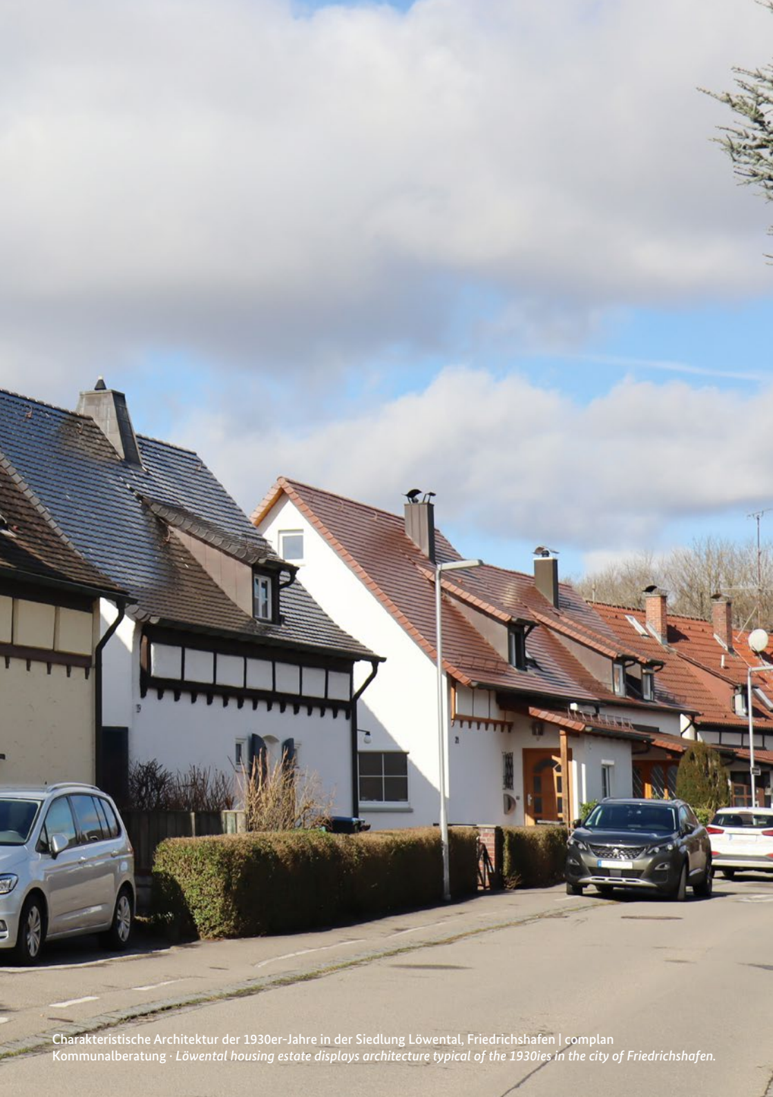
Charakteristische Architektur der 1930er-Jahre in der Siedlung Löwental, Friedrichshafen | complan Kommunalberatung · Löwental housing estate displays architecture typical of the 1930ies in the city of Friedrichshafen.