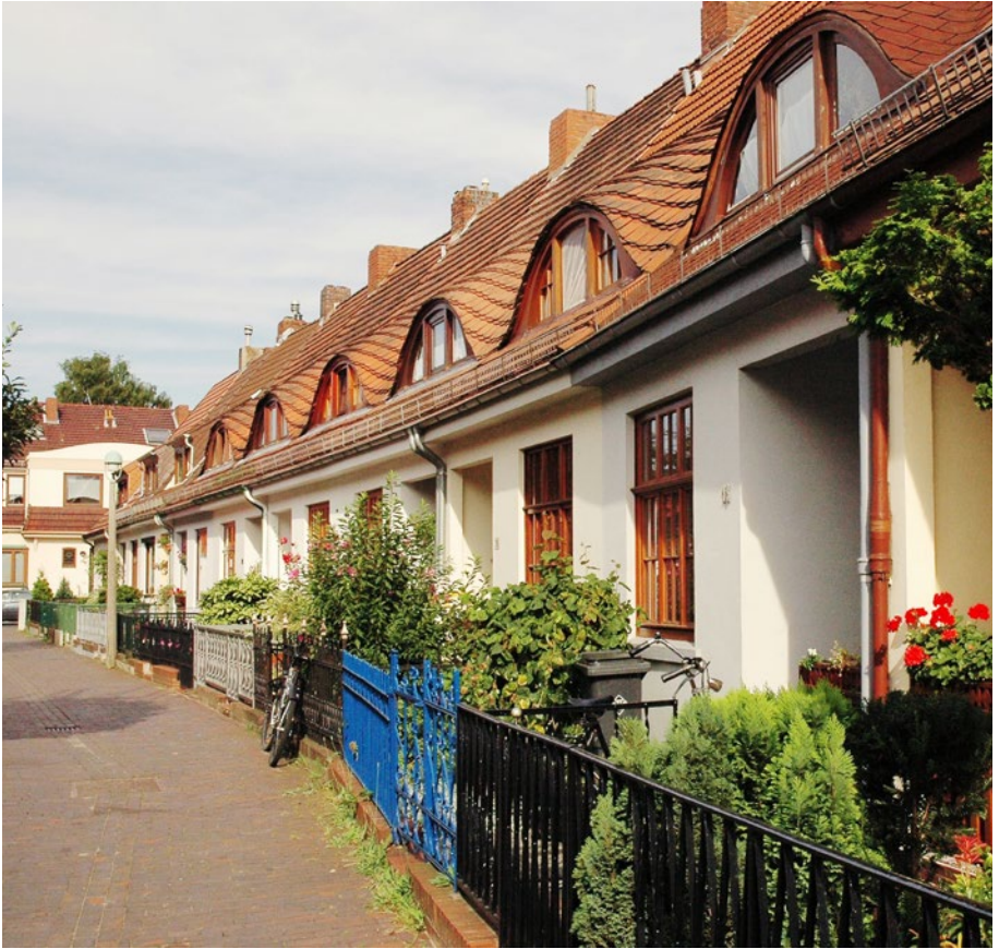
Häuserfassade am Feierabendweg in Bremen Ohlenhof | ASK GmbH Facades in Feierabendweg-Alley, Bremen Ohlendorf

Einige europäische Länder, Regionen, Kommunen und Gemeinden setzen bereits, im Sinne der integrierten Stadtentwicklung und der Leipzig Charta zur nachhaltigen Europäischen Stadt in der Stadtplanung, auf eine bestandsorientierte Weiterentwicklung. Sie beziehen die baulichen und räumlichen Gegeben-