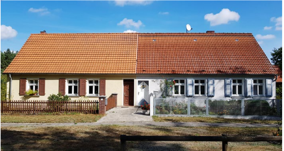
Besonders erhaltenswertes Gutsarbeiter-Doppelhaus im Ortsteil Burow, Gransee | Bruckbauer & Hennen GmbH Typical rural workers' twin houses of high conservation value in Burow village, Gransee

chungsgebiet Erfassungskriterien fest und definiert die Untersuchungstiefe. Um einen ersten Überblick über die potenzielle besonders erhaltenswerte Bausubstanz zu bekommen, reicht häufig eine räumliche Erfassung aus. Dabei geht es um die Identifizierung der städtebaulich prägenden Strukturen und Elemente. Handelt es sich z. B. um eine Siedlung werden die Anordnung der baulichen Anlagen, die Kubatur und Geschossigkeit, das Verhältnis von Baukörpern zu Freiflächen und Grün sowie mögliche Sichtachsen bestimmt. Sollen objektbezogene Daten der potenziellen besonders erhaltenswerten Bausubstanz erhoben werden, weil die Gebäude als besonders wertvoll für die städtebauliche Eigenart des Gebiets eingestuft