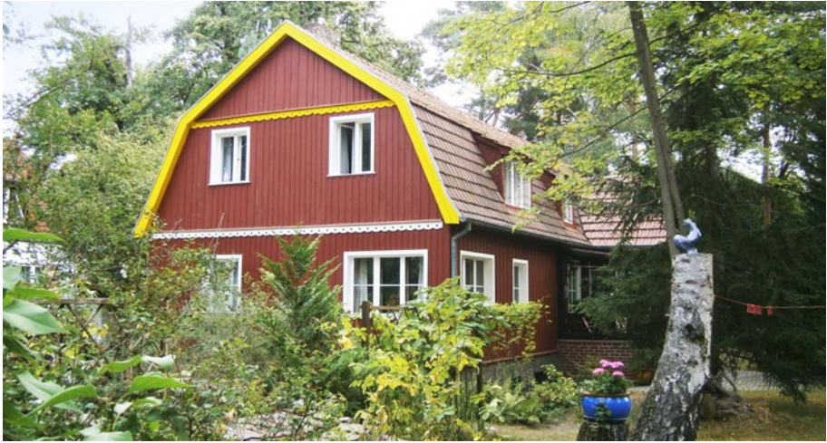
Gebietstypisches Holzhaus in der Berliner Ortslage Wendenschloß A timber house characteristic of building typology in Berlin's Wendenschloß neighbourhood

die erfasste besonders erhaltenswerte Bausubstanz zur Grundlage für die Bewahrung der Gebietstypik ganzer Stadt- und Ortsteile, Quartiere und Siedlungen. Eine objektbezogene Erfassung kann dabei z. B. auch hilfreich sein, um historische Schlüsselgebäude im Stadtgebiet zu erkennen, erhalten und bestandsorientiert weiterzuentwickeln.