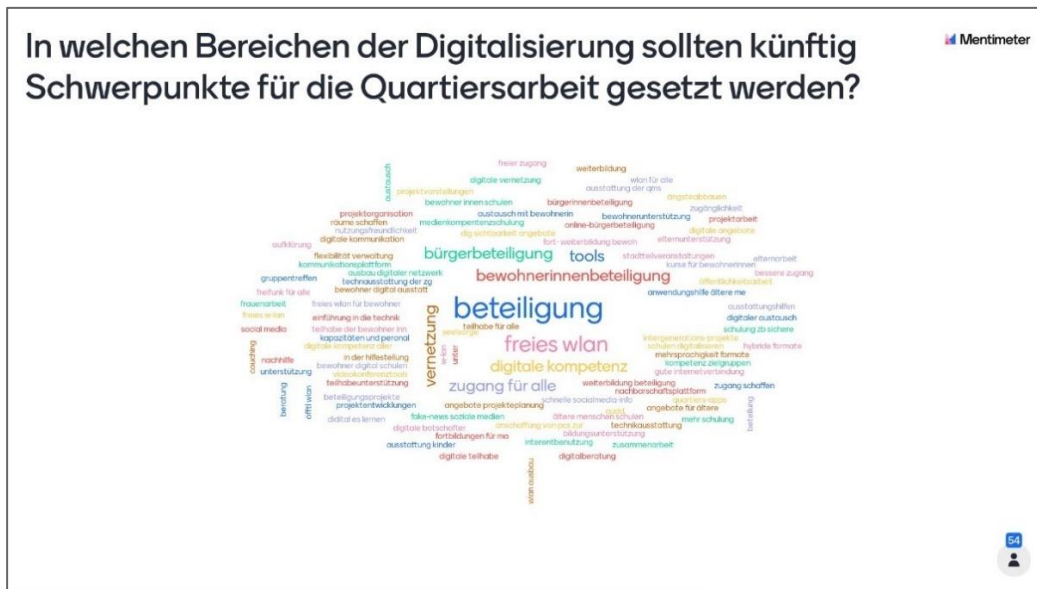
Abbildung 3: Ergebnisse der zweiten Frage zur Digitalisierung über Mentimeter

für alle bzw. freies W-Lan“ als wichtig erachtet. Auch Schulungen für sowohl Mitarbeitende und als auch Bewohnerinnen und Bewohner werden mehrfach genannt. Weitere mehrfach genannte Schwerpunkte sehen die Befragten bei der Bildung (Ausstattung der Kinder, digitales Lernen, Nachhilfe) und einem zielgruppengerechten Angebot für ältere Menschen.