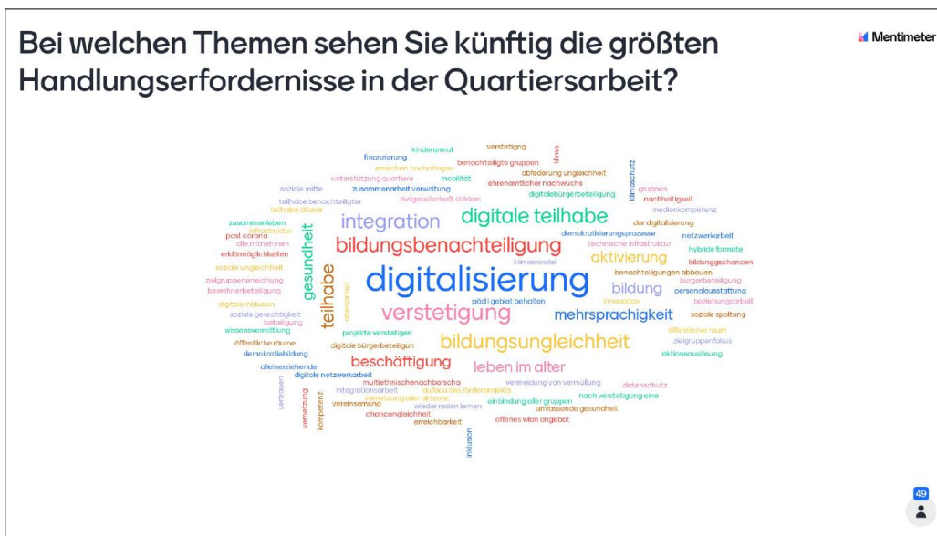
Abbildung 4: Ergebnisse der dritten Frage über Mentimeter zu den größten Herausforderungen in der Quartiersarbeit in der Zukunft

Zum Abschluss wird eine letzte Frage über Mentimeter gestellt. Dieses Mal sollen die Teilnehmenden die größten Handlungserfordernisse in der Quartiersarbeit für die Zukunft benennen. Die Antworten sind sehr vielfältig. Die Digitalisierung und verwandte Themen nehmen einen großen Platz ein, ebenso das Thema Verstetigung und die Bildungsthematik – Bildungsbenachteiligung/Bildungsungleichheit. Doch auch Integration, Gesundheit, Klimaschutz und (zielgruppengerechte) Beteiligung werden mehrfach genannt. Weitere Handlungserfordernisse und Themen werden gesehen bei der Netzwerkarbeit, Mobilität und Beschäftigung.