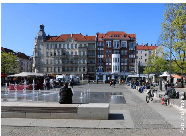
Plan und Praxis