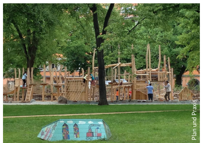
Plan und Praxis