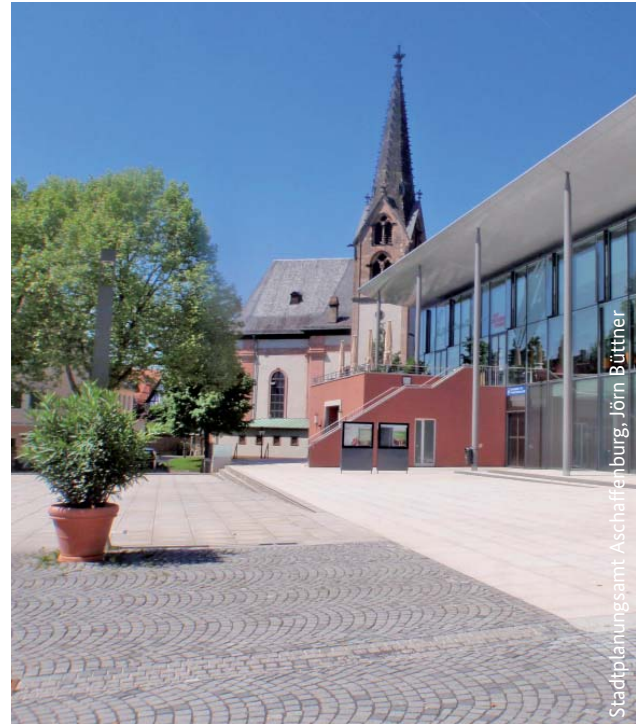
Stadtplanungamt, Aschaffenburg, Jörn Rüttner

Als Veranstaltungsort wurde die Stadt Aschaffenburg in Bayern gewählt. Es wird ein Rundgang durch das dortige Programmgebiet Innenstadt angeboten. Zusätzlich bietet die Veranstaltung die Möglichkeit, weitere konkrete Sachfragen zum Zentrenprogramm in einer offenen Runde zu reflektieren.