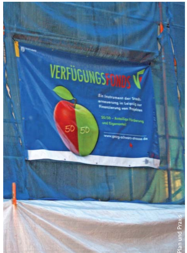
Plan und Praxis